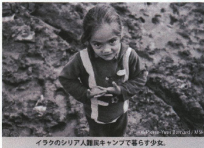
イラクのシリア人難民キャンプで暮らす少女。